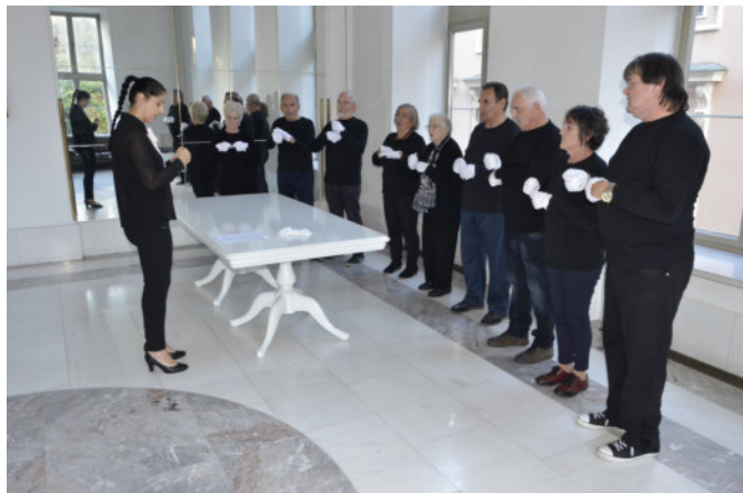
Generalka gluhih članov Društva iz kulturno umetniške skupine »Tihi svet« za nastop na »Kulturnem večeru invalidov Maribora« v Slovenskem narodnem gledališču Maribor

V programu člani sodelujejo in ustvarjajo ter predstavljajo lastne izdelke na ustvarjalnih gledaliških delavnicah, likovnih delavnicah, delavnicah za video in foto ustvarjanje.