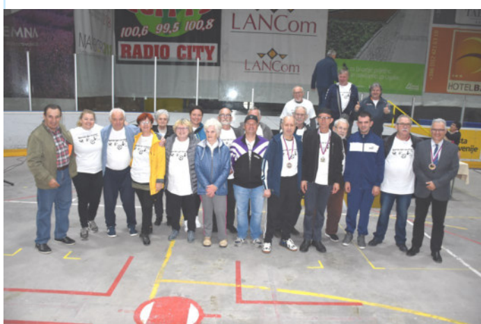
Množična udeležba gluhih in naglušnih športnikov na Športnih igrah invalidov v organizaciji Sveta invalidov Mestne občine Maribor, 19.5.2023