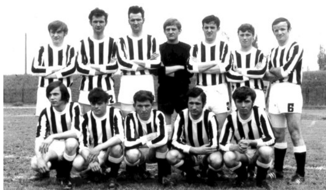
Prvič državno prvenstvo gluhih v Sloveniji, 18.5.1970

Dobri rezultati in sodelovanje na športnih tekmovanjih so dobra spodbuda za nadaljnji razvoj športa med invalidi sluha.