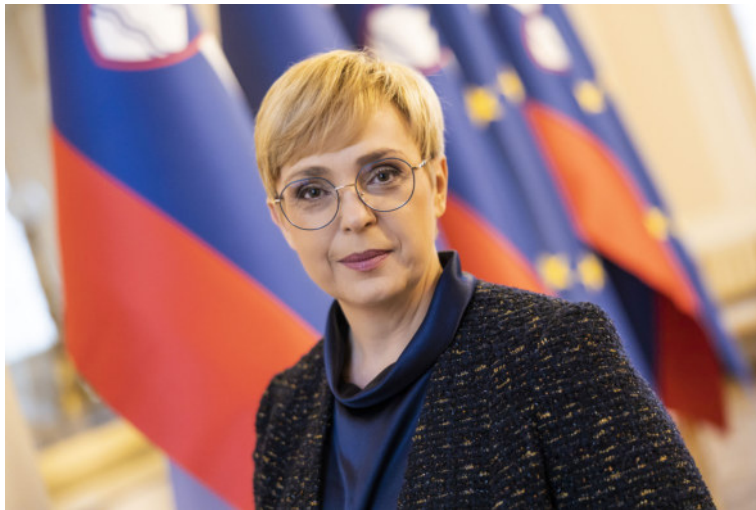
predsednica Republike Slovenije, dr. Nataša Pirc Musar