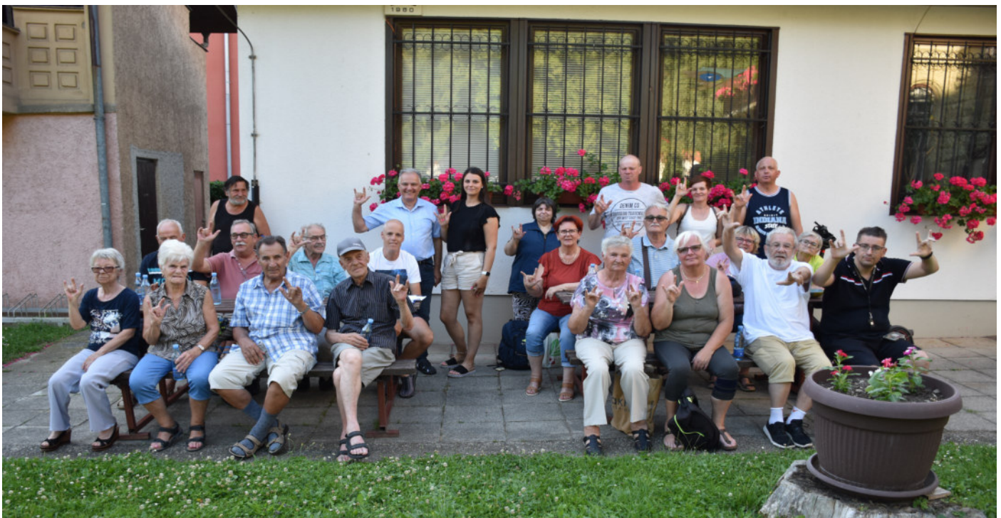
Člani društva na dvorišču društva kažejo kretnjo »Rad te imam«