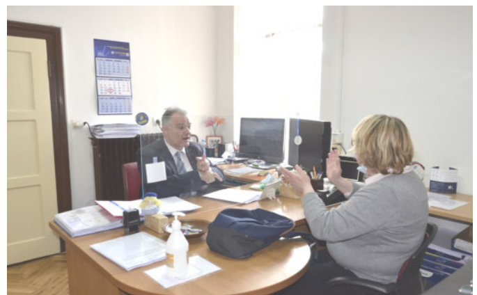
Svetovanje in pomoč pri iskanju zaposlitve

Razumeti in biti razumljen je osnovno vodilo vsakega človeka. Osebe z okvaro sluha imajo zaradi svoje invalidnosti veliko ovir v številnih življenjskih situacijah, še zlasti pri dostopu do informacij, kar zelo vpliva na njihov neenakovreden položaj v družbi. Zato v društvu nudimo strokovno in individualno pomoč v njim prilagojenih tehnikah in oblikah komunikacije. Posredujemo jim ključne informacije, usmeritve, povezujemo uporabnike z ustreznimi javnimi in drugimi službami, nudimo svetovanje in pomoč posameznikom pri prepoznavi njihovih problemov in iskanju rešitve za nastale življenjske situacije.