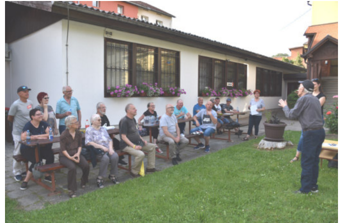
Ob lepem vremenu imamo info-okrogle mize najraje na svežem zraku, na dvorišču društva

Spletno stran smo večkrat posodobili in nadgradili. Nato smo leta 2008 izdelali še družabno omrežje http://www.facebook.com/drustvo.maribor .