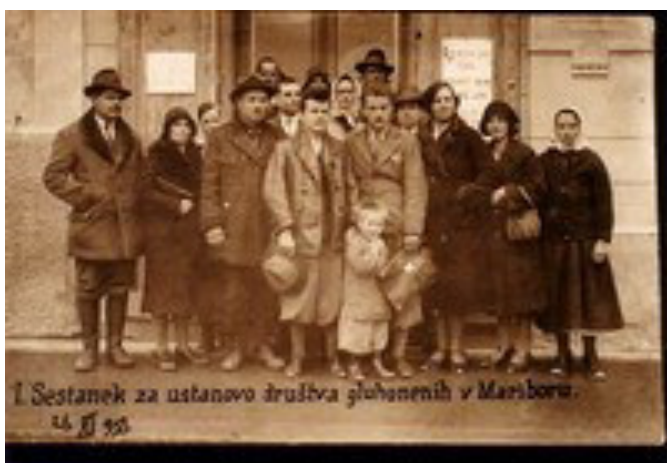
Udeleženci sestanka za ustanovitev društva