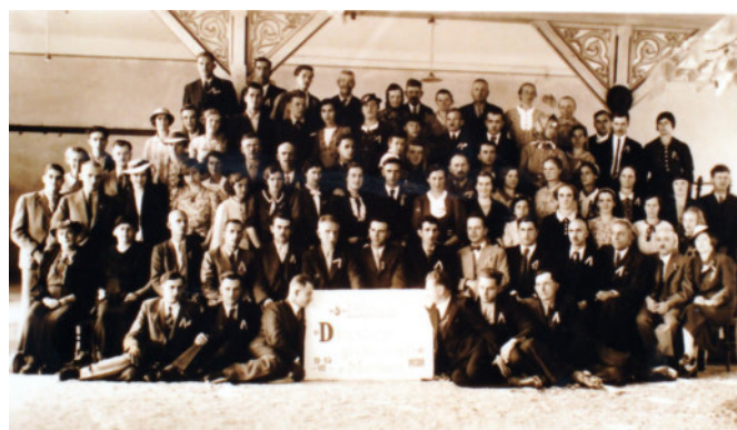
Masovno srečanje članov,

Nemška okupacija je prepovedala delovanje vseh dotedanjih slovenskih organizacij, združenj in društev. Slovenski jezik se uradno ni smel več uporabljati. Toda, gluhi so med seboj še vedno ostajali v stiku. Potrebovali so komunikacijo. To je spoznal tudi okupator in jim 1942 leta omogočil prvi nemški govorni tečaj za slušno prizadete. Gluhi so ta tečaj izkoristili za vzdrževanje medsebojnih stikov za informiranje in za nudenje pomoči sočlanom.